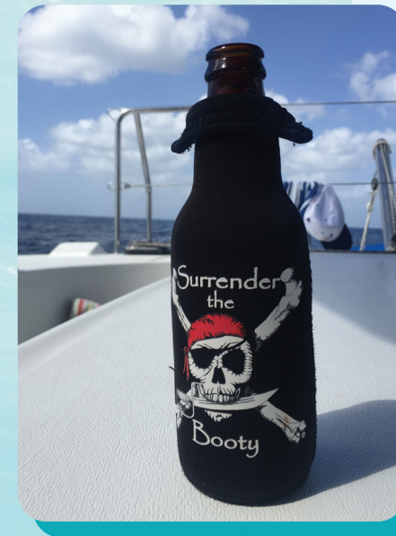
Book a catamaran trip

Curabitur semper orci nunc, et tincidunt lacus molestie ut.